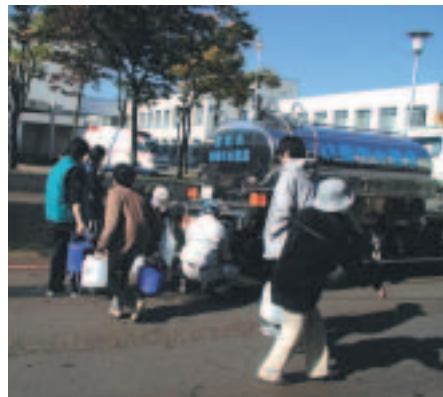
新潟県中越地震での給水支援

に口元いっぱいまで入れ、直射日光の当たらない風通しの良い場所に保管します。水道水は塩素で消毒されているため、三日間程度は保管でき、飲料することができます。 〇：問い合わせは水道整備課☎890-3033へ。