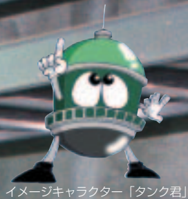
イメージキャラクター「タンク君」