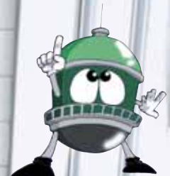
イメージキャラクター「タンク君」

安全でおいしい「前橋の水」を蛇口からお届けします。 水道局では、次世代を担う小学生に水道水のおいしさを実感してもらうため、城南小学校をモデル校として、貯水槽を経由しないで配水本管から直に給水を行える直結給水方式を導入しました。本管からの新鮮でおいしい水が利用できるようになりました。