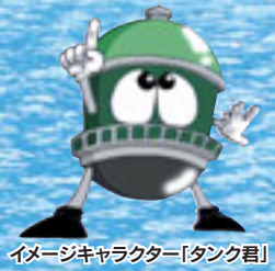
イメージキャラクター「タンク君」