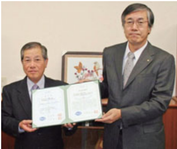
※平成23年12月26日 (社)日本水道協会尾崎専務理事より認定証を授与

認定番号：JWWA-GLP075 事業者名：前橋市水道局 水質検査機関名：上下水道部浄水課 認定範囲：水道水質基準項目 認定日：平成23年11月29日