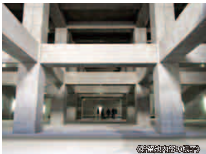
〈貯留池内部の様子〉