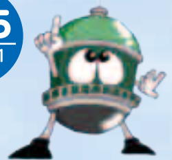
前橋市水道局キャラクター「タンク君」