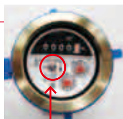
パイロットマーク