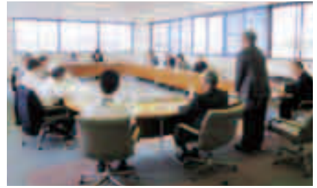
〈運営審議会の様子〉

☎経営企画課 ☎027-898-3012、水道整備課 ☎027-898-3022