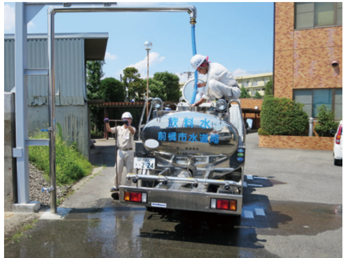
昨年度、水道局に設置した応急給水塔から給水タンク車への給水訓練

前橋市水道局では、災害や事故等による不測の事態に備えるため、様々な訓練を実施しています。今回は給水タンク車を活用するための応急給水訓練と、水質事故が発生したときに皆様にお知らせするための広報車を使った広報活動訓練を実施しました。