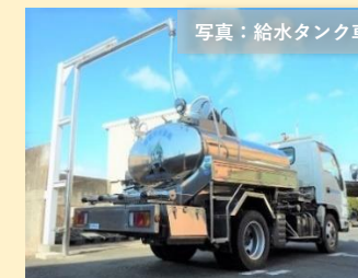
写真：給水タンク車