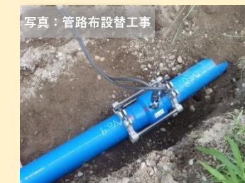
写真：管路布設替工事