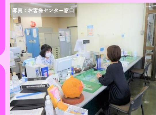
写真：お客様センター窓口