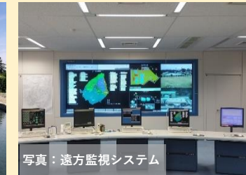
写真：遠方監視システム