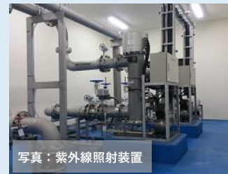
写真：紫外線照射装置