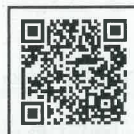
違反対象物公表制度