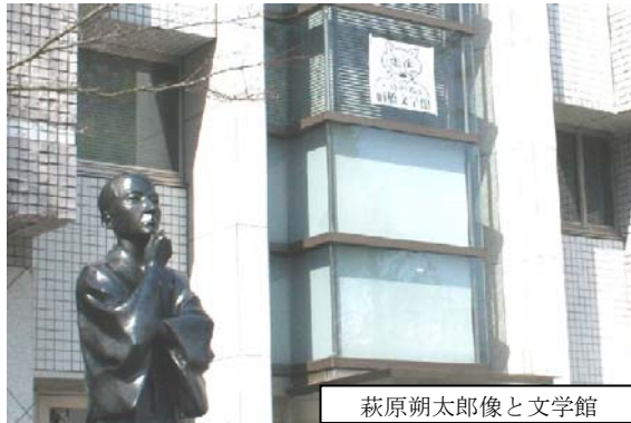
萩原朔太郎像と文学館