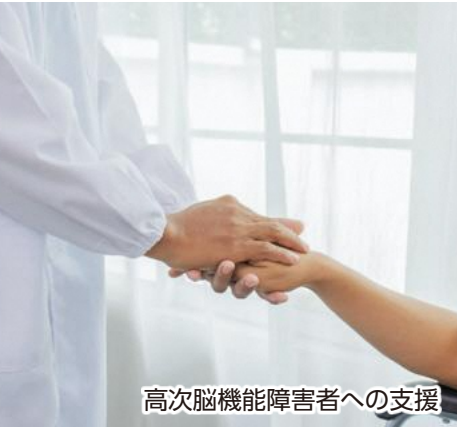
高次脳機能障害者への支援

〈答〉当事者へは、個別の状況を確認し、必要な障害福祉サービスを提供しています。当事者団体とは、意見交換会を実施して家族が抱える状況の情報共有や、団体主催の事業に対し、市が後援を行うなどの支援をしています。高次脳機能障害はそれぞれの実情を捉えにくいとされているので、周囲に理解者が増えることで当事者が安心して暮