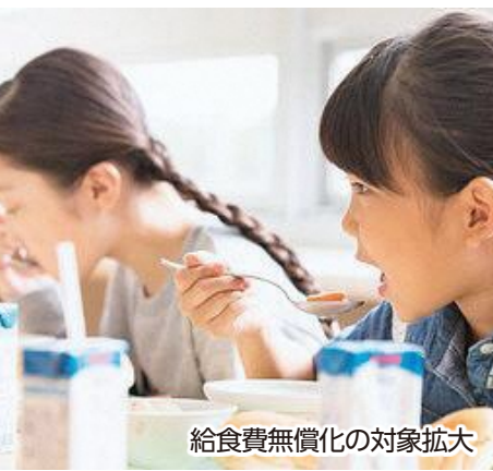
給食費無償化の対象拡大

〈答〉国の制度設計においても、令和八年度からの無償化については公立小学校に限られたものとなっております。財源確保の課題がありますが、議会でも、議員の皆さんから後押しする質問をたくさんもらったので、今後についてはしっかりと検討し