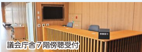
議会庁舎7階傍聴受付