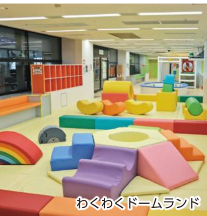
わくわくドームランド

〔答〕二月二十二日のオープン日と翌日は、混雑緩和と安全確保のため、三十分の入れ替え制で運用し、二十二日は二百九人、二十三日は百五十五人と多くの利用がありました。二十四日以降は通常どおり一時間入れ替え制で運用し、子どもの利用数は平均で一日当たり九十二人です。