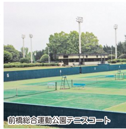
前橋総合運動公園テニスコート

〈答〉利用者がテニスコートを利用できない期間を極力短縮できるように配慮し、工事期間を分割して対応します。令和八年度