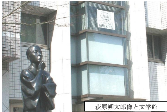
萩原朔太郎像と文学館