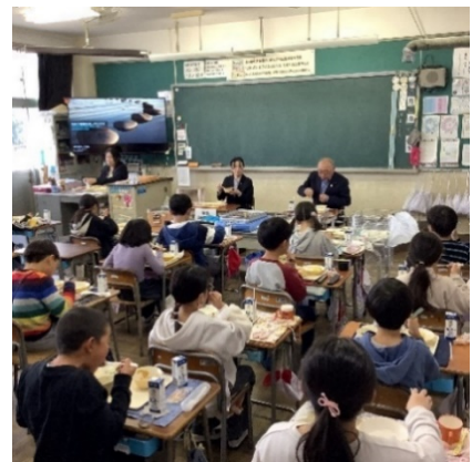
【R7.11.25 元総社北小学校3年生】

（献立）まえばし麦豚すきやき、 黒米ごはん、だし巻きたまご、 大根のあさづけ、牛乳、 さつまいもデザート