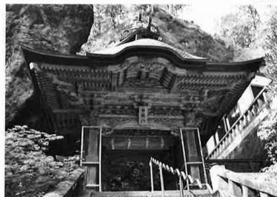
榛名神社双龍門(高崎市榛名町)