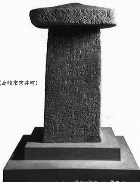
多胡碑(高崎市吉井町)