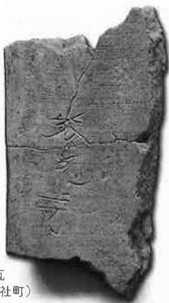
放光寺銘瓦 (前橋市総社町)