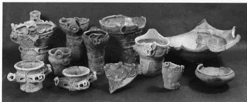
五代深堀 I 遺跡No.2出土遺物(前橋市五代町)