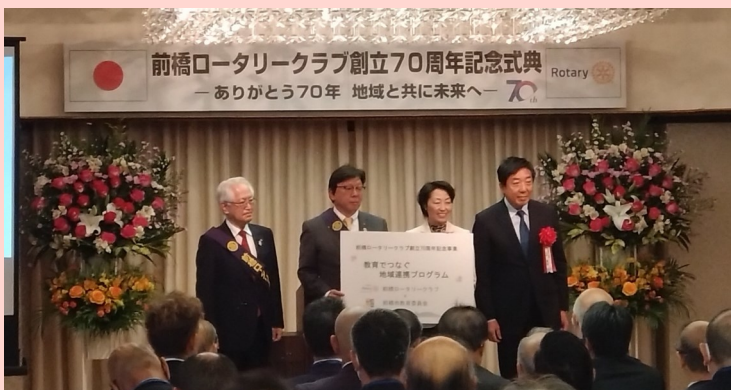
令和5年11月11日(土) 前橋ロータリークラブ創立70周年記念式典