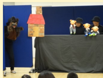
▲人形劇（前回開催）の様子