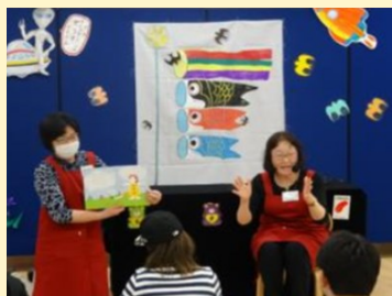
▲紙芝居（前回開催）の様子

こども図書館では5月3日から5日までの3日間、「こどもの日フェスティバル」を開催します。個性豊かなボランティアの皆さんが、盛りだくさんの内容で、お子さんを物語の世界に誘います。気が付くと大人の方が夢中になっていることも・・・ 当日は自由にご参加いただけますので、ご家族で読書の楽しみを見つけにこども図書館へ！