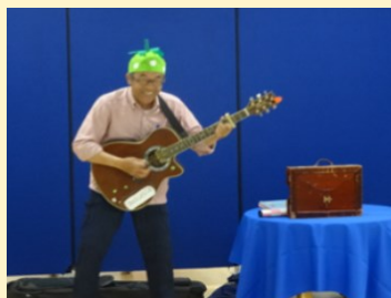
▲紙芝居ライブ（前回開催）の様子