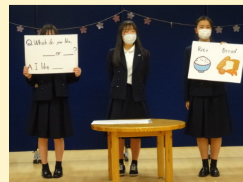
▲前橋女子高校の学生による練習風景の様子(R4.4.14撮影)