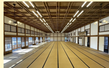
▲180畳の別館大広間は圧巻

文化財保護係では、このような文化財施設の管理や、資料館の運営、文化財の普及啓発などを行っています。