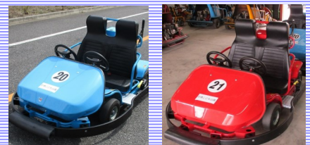
児童図書の 買替え331冊 【図書館】

子どもたちに大人気のかいけつゾロリや科学系マンガ（シリーズ物）などを買替えさせていただきました。