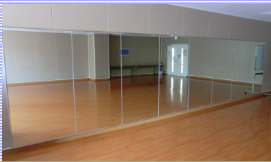
中央公民館スタジオ壁面ミラー 計22枚（5部屋分）設置 【中央公民館】

～市教委が目指す「多様な人と協働しながら主体的、創造的に社会と創る人」を育むため、今後も皆様のご支援とご協力をお願いします。～