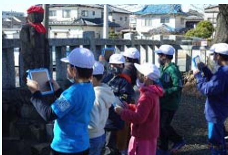
校外活動の場でも活用しています！

タブレット端末を子どもたちが毎日家に持ち帰るため、お便りや配付物をデジタル配信することで書類の紛失や持ち帰る量も減りました。また、家庭へのアンケートもタブレットを通じて一瞬で集計できるため、教員の労力も大幅に縮減することができています。