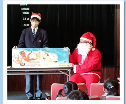
▲12月のJRC部の読み聞かせ②風景