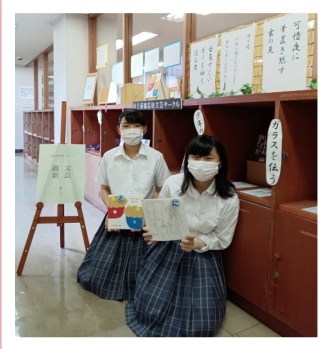
▲7月の文芸サークル作品展示風景