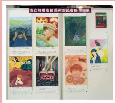
▲11月の美術部「読書感想画展」の展示風景