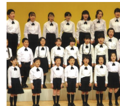
Music Concert 2023