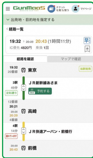
● リアルタイム経路検索