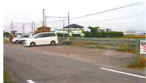
上泉駅前 駐車場 (13台)

パーク＆ライド無料駐車場とは、上電利用者専用の無料駐車場です。 通勤・通学といった定期利用のほか、1日だけのご利用もちろん可能です。 ※ただし定期利用の方を優先とさせていただきます。