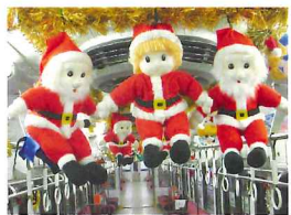
クリスマスト레인 11月中旬～12月25日まで