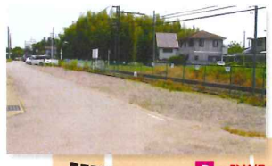
北原駅前 駐車場 (26台)