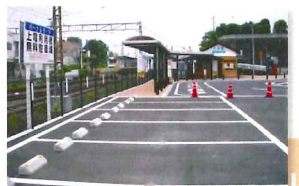
大胡駅前 駐車場 (32台) 送迎者用 (5台)