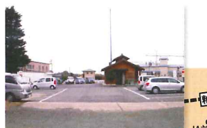
柏川駅前 駐車場 (24台)