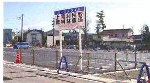
江木駅前 駐車場 (38台) 送迎者用 (5台)