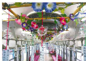
風鈴電車 6月中旬～8月末まで