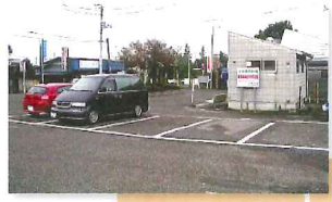
新里駅前 駐車場 (46台)