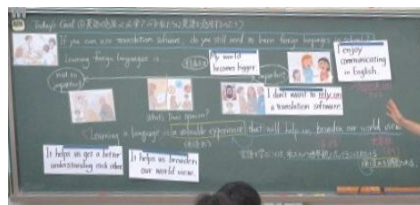
図1 肯定派の様々な見見を出した板書

毎時間の授業の終末には振り返りを位置付け、題材に対する考えや気づきを整理できるようにした。本授業では「英語を学ぶ必要性について、新たな見見や学びがあったか」「それを参考にしながら自分の考えを述べられたか」という視点を示し振り返りを行うことで、生徒の考えの変化を可視化し、単元のゴールとなる言語活動につなげられるようにした。