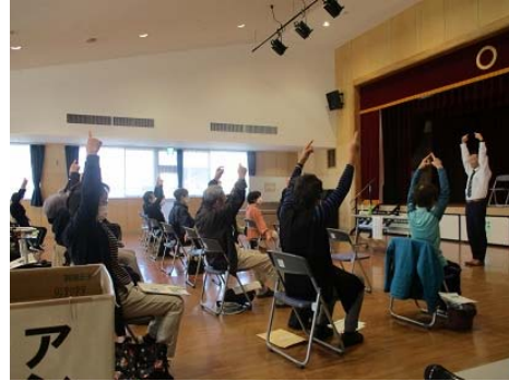
「脳トレや体操でいきいき活動。 楽しく体を動かし介護予防・フレ イル予防を目指しましょう！」