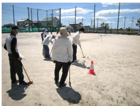
マスク着用で楽しくプレイ