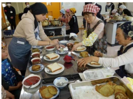
ウクライナ料理の調理の様子

にスポットを当てた講座を実施した。初の試みであったが、参加者からは継続を求める声や、更なる企画の提案もあり、非常に好評であった。