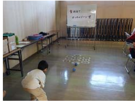
的当てボッチャの様子