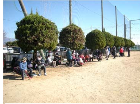
休憩時間は楽しくおしゃべり