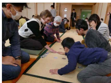
上毛カルタ体験の様子