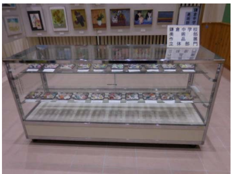
立体部門展示の様子