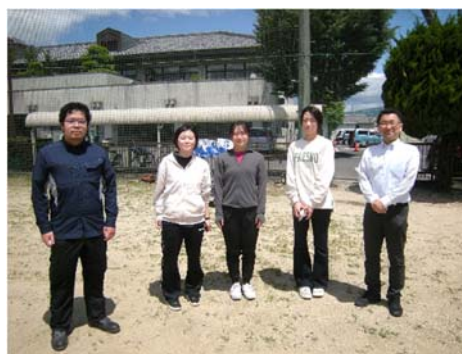
群大生も体験で参加してくれました