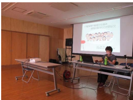
「介護保険や制度の仕組み・地域の見守りで大切なこと」

全講座に共通して、想定より参加者が集まらなかった点が残念であった。コロナ以降、地域住民の講座離れがある様にも感じる。少人数の講座の良さもあるが、地域の医師や大学教授に教えていただく貴重な機会であるので、集客を目指し、新しい周知方法も検討したい。