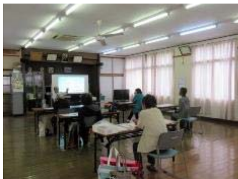
手づくり布絵本教室（人権教育）

次年度も市民の方が様々な機会に興味を持ち、参加者同士の交流が保てるような講座を実施したいと思う。