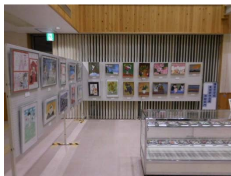
油絵部門展示の様子 2