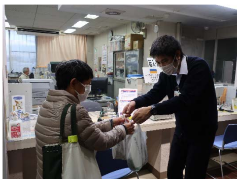
参加賞お渡しの様子