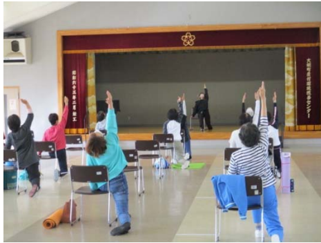
イスを使ってストレッチ