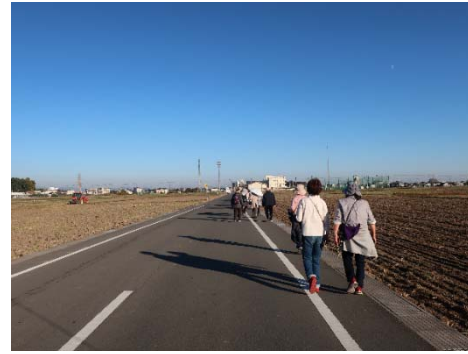
ウォーキングの様子