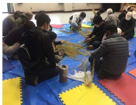
第3回 12/16 しめ縄づくり講座