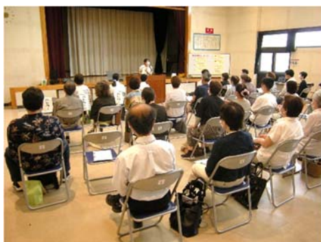
7人のバトルが本を紹介しました