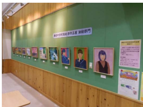
油絵部門展示の様子 1

昨年度に引き続き、鎌倉中学校との共催で美術部の生徒が制作した作品を展示する「作品展」を実施した。展示作品を写真に撮り、ホームページへ掲載する「オンライン作品展」も実施し、いつでも作品を鑑賞できる環境を提供することができた。展示した作品は、生徒それぞれの個性がとても表現されており、見応えがあるものが多くあった。このようなハイブリット形式(来館とオンライン)などの新たな試みを今後も模索しながら、少しでも学びや活動の場、地域住民の心の癒しを提供できるよう心がけていきたい。