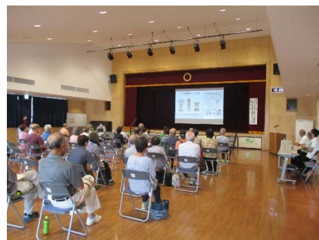
「イチからわかる！ロボット支援手術」