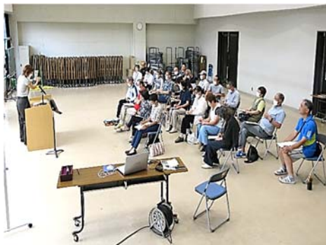
ビブリオバトルの様子

募集した当初は、発表者、観戦者ともに応募は低調であったが、生涯学習奨励員連絡協議会に協力をいただき、予想以上に多くの参加者があり実施ができた。発表者の中には、資料を掲示するなどの工夫をして、分かりやすい発表を行っていた。また、発表後のディスカッションも活発であった。