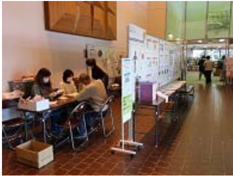
保健推進員による計測の様子