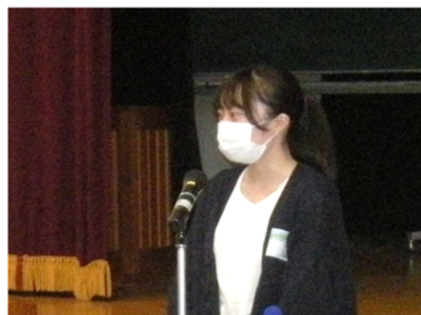
高校生の参加もありました