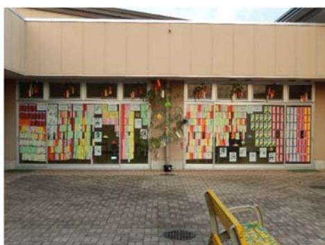
展示全体の風景 （中庭）

また、展示期間中、特に休日に多くの親子やその家族が短冊展示を観に足を運び写真を撮っている様子が見受けられた。その様子を見ていると、事業目的のほかに、親子等で足を運ぶ楽しい場所の提供も併せて出来たのではないかと感じると共に、今後もマンネリ化せず、より多くの方に足を運んでもらえるよう展示の仕方などを創意工夫していきたい。