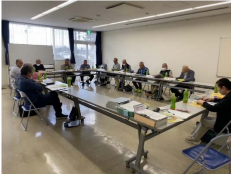
「知っておきたいこと ～認知症ケアパス～」