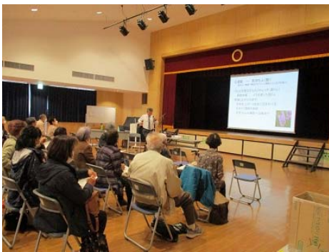
「健康で楽しく生きるために」