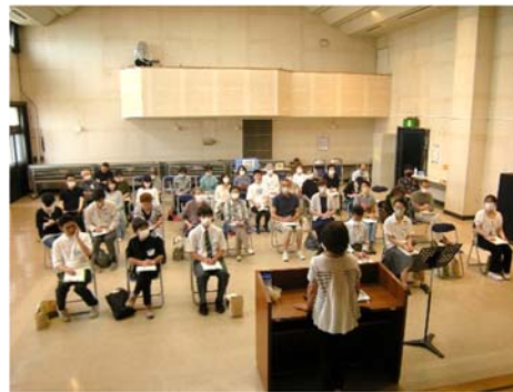
多くの方に参加していただきました