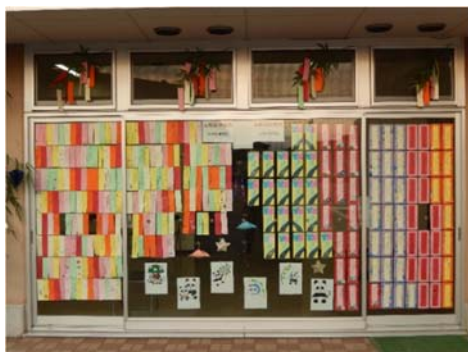
南側半分の展示風景 （中庭）