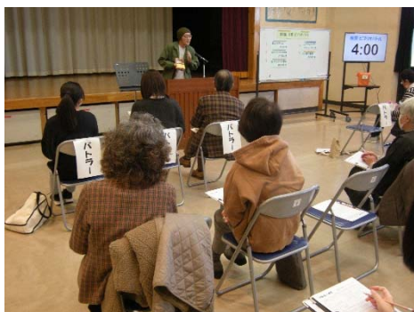
5人のバトラーが本を紹介しました