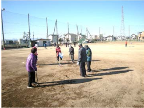
ゲームを通じて健康づくり