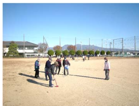
たくさん歩いて健康維持