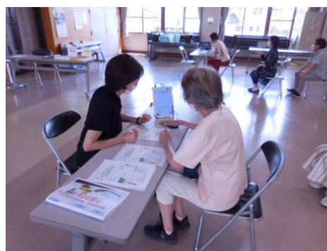
ベジチェック測定の様子