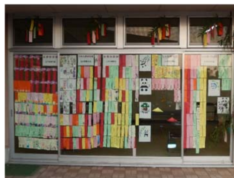
北側半分の展示風景 （中庭）