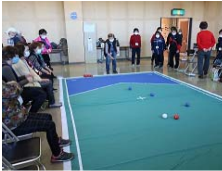
ボッチャ交流会の様子