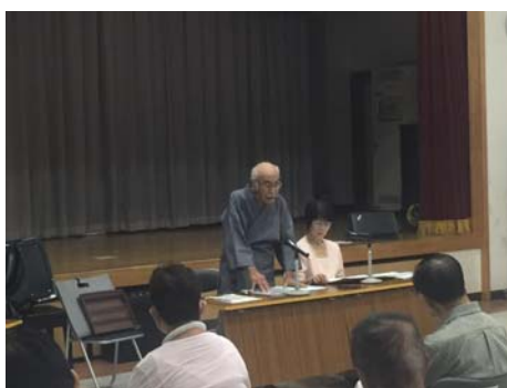
第1回 8/4 学び講座 「下川淵の昔話が教えてくれたもの」

また、本年度は健康づくりを目的とした講座を行った。下川淵老人クラブ連合会が春にウォーキング講習を受けている縁もあり、講師は群馬ヤクルト販売株式会社に依頼し、また、講座内容は老連役員からの要望を反映して、睡眠改善の講座を実施した。脳と腸に密接な関係があるため、食生活の見直しや乳酸菌の活用で快適な睡眠となることなど学習し、参加者の健康意識の改善につながった。