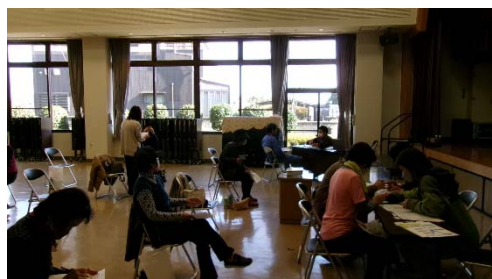
フィードバックの様子