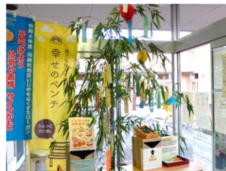
玄関ホールでの展示風景