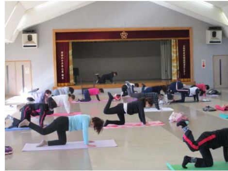
ピラティスエクササイズ