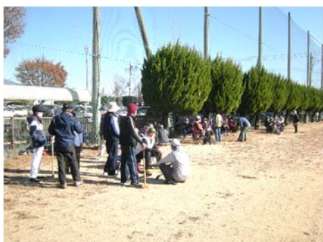
おしゃべりが楽しい休憩時の様子