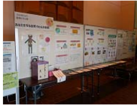
パネル展示の様子