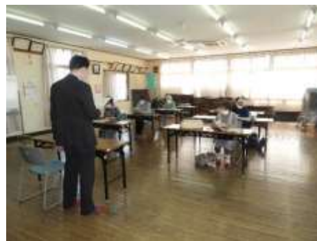
人権について考えよう