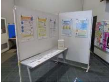
食品ロスパネル展示