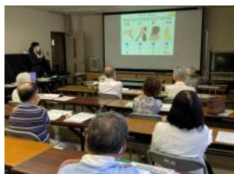
認知症予防の脳トレを体験