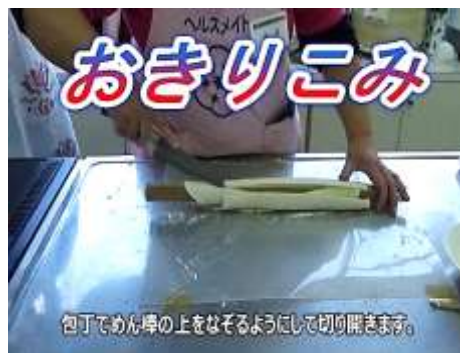
おきりこみの様子