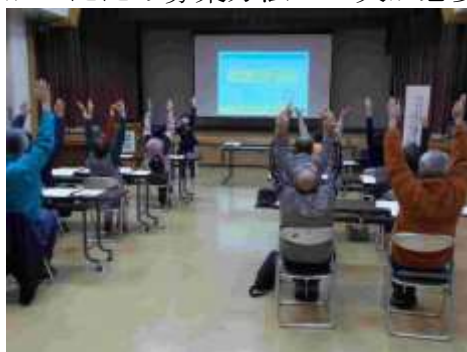
睡眠と健康の知恵袋の様子

館報の掲載、回覧、来庁者へ声掛けをして募集したが、いずれも定員に達しなかったため募集方法の工夫が必要。