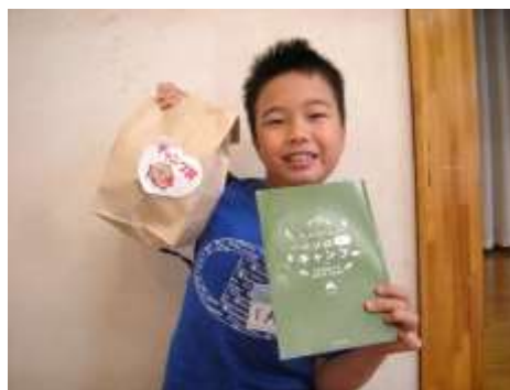
小学生の発表がチャンプ本になりました