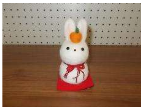
出来上がった作品