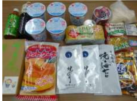
提供された食品（一部）