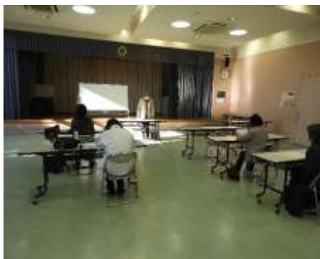
人権について学ぶ