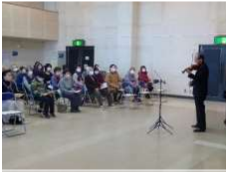
コロナ禍はマスクを付けて