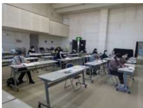
講師の説明を熱心に聞く受講生