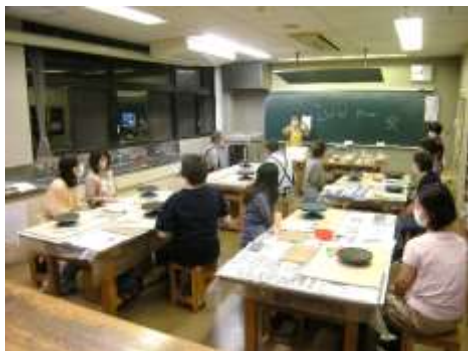
参加者の間隔を空けて行いました

残念ながら男性の参加者は2人だけだったが、現役世代（60歳未満）の参加者が過半数を占め、目的の一部は達成できたと思う。今回の講座が参加していただいた方の趣味の幅を広げるきっかけになればよいと思う。