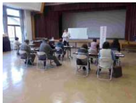
スマートフォン活用講座の様子