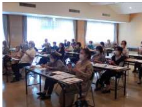
フレイルにも脳トレが有効！