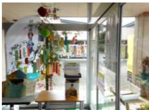
玄関ホールでの展示風景

なお、今回は衆議院議員通常選挙と重なり、より多くの方に短冊展示を観てもらう機会となり、普段、公民館へ足を運ぶことのない方々に、公民館事業の一部を知ってもらえたのではないかと思うと共に、マナー化せず、来年も多くの方に足を運んでもらえるよう工夫した展示を検討しなければと感じている。