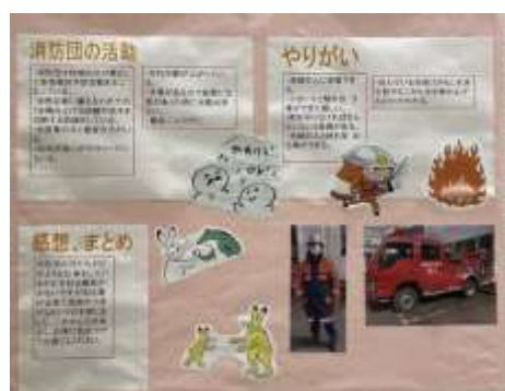
消防団活動紹介のパネル