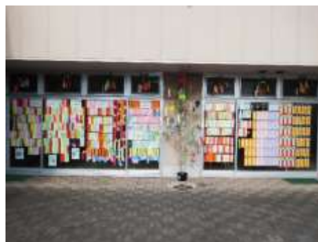
中庭から観た ホールロビーからの展示風景