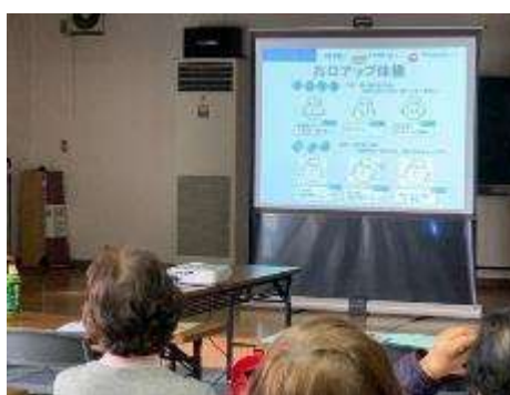
お口アップ体操の様子