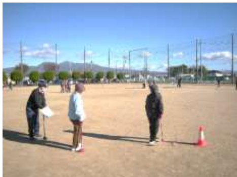
和気あいあいと楽しくプレイ