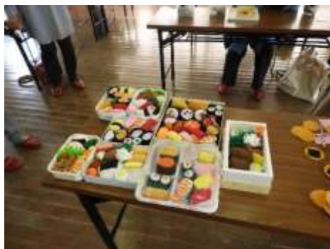
手づくり布絵本教室 (弁当箱)

次年度も市民の方が様々な機会に興味を持ち、参加者同士の交流が保てるような講座を実施したいと思う。