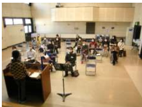
5人のバトルヤーが本を紹介しました