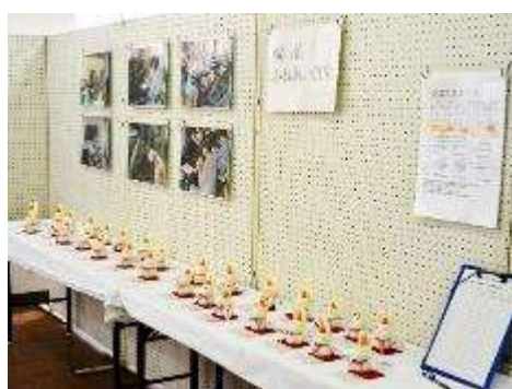
地区文化祭へ作品を出展