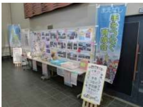
手をつなぐ育成会展示展

今回前橋市手をつなぐ育成会、特別支援学校、福祉作業所物販などコラボして実施することにより、より一層地域住民に対して障害福祉や人権に対する啓発を実施できました。