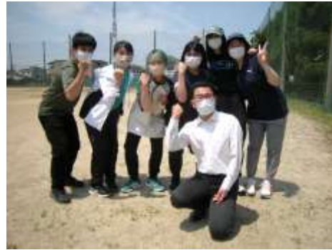
群大生も体験で参加してくれました