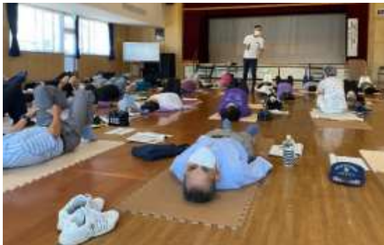
「若返りエクササイズ」

その他、どの講座も申込時には定員超となっていたため、講師のいない名作映画会では、午後にも開催することで、定員のために受講できない方が出ないように努めた。