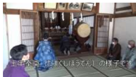
ひな祭りで実施される儀式の様子も紹介