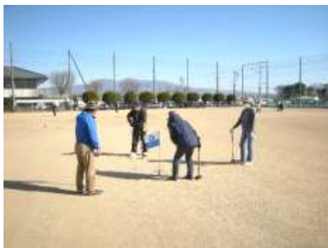
ゲームを通じて健康づくり

続けて参加していただく方も多く、地域の方々の健康づくりとコミュニケーションの場として一定の成果あげていると思う。