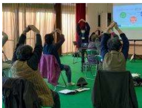
座ったままできる体操の様子