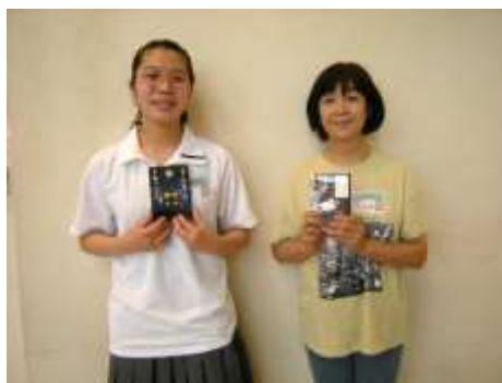
今回は2冊がチャンプ本になりました