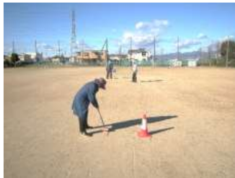
ホールインワンも出るようになりました