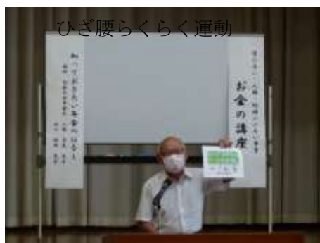
年金テキストを利用して講義

2つの講座を比べると、民間企業の講師の方が説明が分かり易いだけでなく、クイズをしたりスマホをいじらせたりして、受講生を飽きさせない工夫をしていた。なお、今回の講座の反省点は、今後の講座に活かしたい。