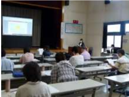
受講生が熱心にお金の勉強