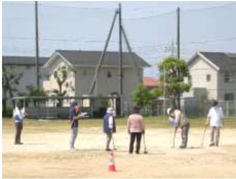
マスク着用で楽しくプレイ