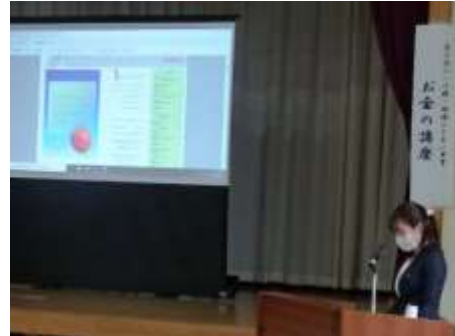
プロジェクターを使って分かり易く