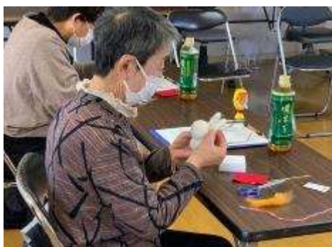
耳の取付け位置を考え中・・・

来年度は、老人クラブ未所属である高齢者の募集方法や各町の高齢者の学習ニーズを把握して、充実した内容としていきたい。