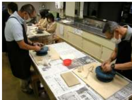
みなさん集中して作品を作りました