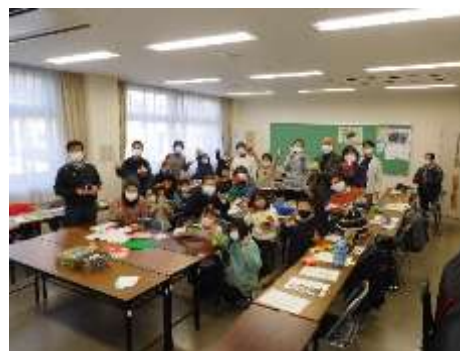
完成品を持って記念撮影