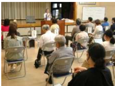
6人のバトラーが本を紹介しました