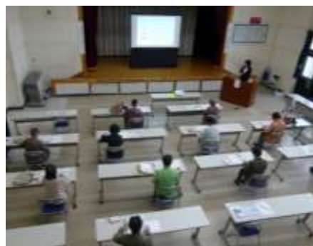
健康増進講座全体の様子