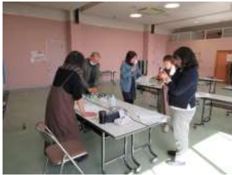
趣味と健康づくり (日々の暮らしにエッセンスを)