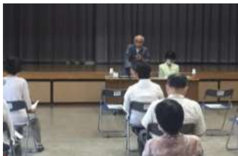
第1回 8/3 学び講座 「下川淵の伝承民話が教えてくれたもの」

あり、地域住民が積極的に学びを得られる機会となった。また、浸水災害が想定される地域であることから、住民の関心が高い防災に関する講座を開催した。各町の公民館でも、同時期に同じ講座を開催していたことから参加者数は低く目に落ち着いたが、その分ひとりひとりの対応ができ、有事に命を守る行動を促すことにつながると感じた。