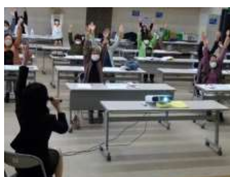
講師に合わせてストレッチ