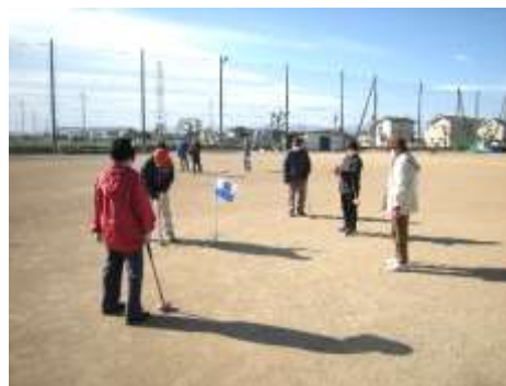
みなさん笑顔で楽しくプレイしています