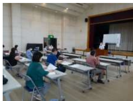
コロナ禍の講座は間隔を空けて