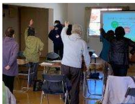
手足を使った脳トレ体操の様子