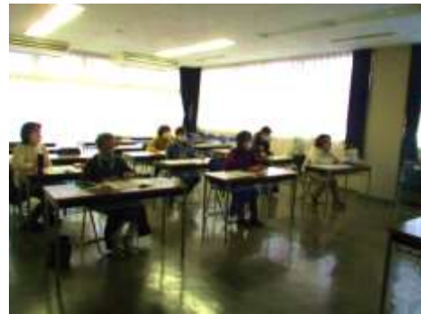
講座参加者の様子