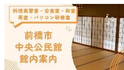
料理実習室・会議室・自治会室・パソコン研修室