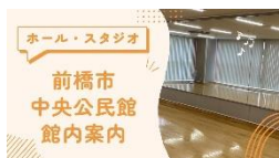
ホール・スタジオ