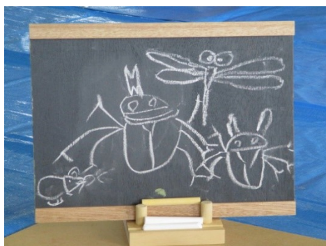
「木工」黒板完成！絵も上手です！