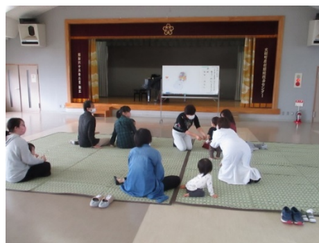
3館合同の「親子でリトミック」