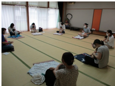
赤ちゃん体幹運動

アンケートでは、参加者全員から「とても分かりやすく良かった。今後子育てをしていく中で取り入れていきたい。」という声をいただいた。