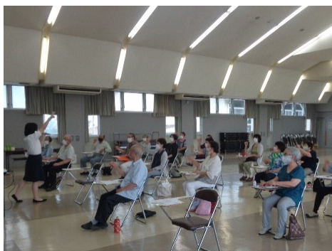
夏バテ予防と熱中症対策

今回は、企業及び大学の出前講座により実施したが、アンケート結果からはいずれも講座満足度が90%以上と高く、学習主題に沿って対策や知識の習得など健康を健やかに保つための学びができたのではないかと思う。また、休憩時間や講義の中で行われた血管年齢測定や手洗いの洗い残し体験なども好評であった。