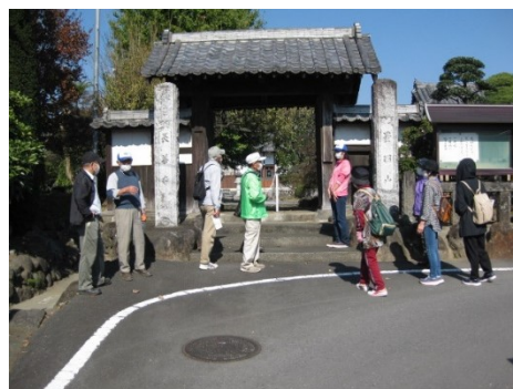
大胡地区内史跡めぐり