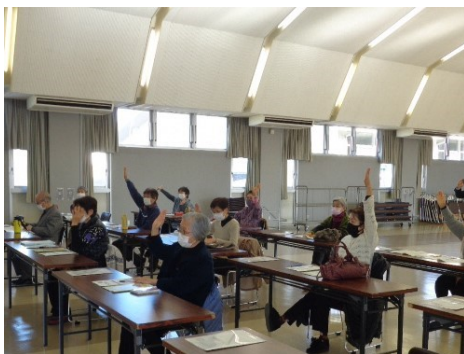
人生 100 年時代のシニアライフを考えよう