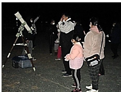
天体望遠鏡による星空観望①

天体望遠鏡による星空観望では、雲もなく観望しやすい状況の中、実際に星や星座を見ながら解説を聞くことで、子どもたちにもわかりやすく、天体等への知識を深めることができた。また、講師の解説に対し、子どもたちが積極的に質問している様子から好奇心旺盛さが感じられた。アンケート結果からは、赤城山のふもと(大胡)で見る星空について、ほとんどの子どもたちが「とてもいいなと思った」と回答していることから、地域の良さに気づく体験を提供することができた。