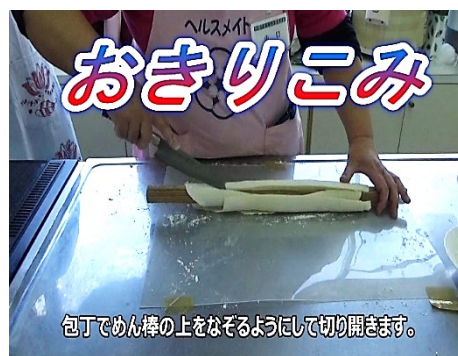
おきりこみの様子