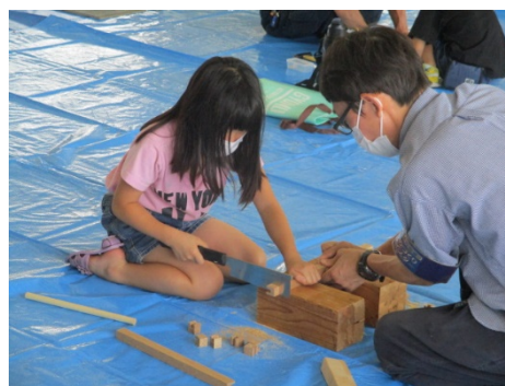
「木工」のこぎりに挑戦中！