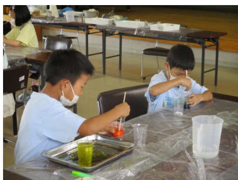
「サイエンス」スライムできるかな？！

全体を通して、開催した全講座で期待していた定員に達しなかったことから、内容の見直しを行い次年度に向けて検討を行うこととしたい。