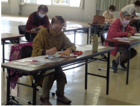
生きた証をこれからに活かそう