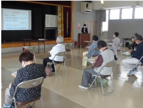
血液や血管と生活習慣の話