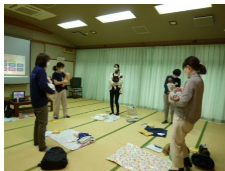
親子のふれあいタイ