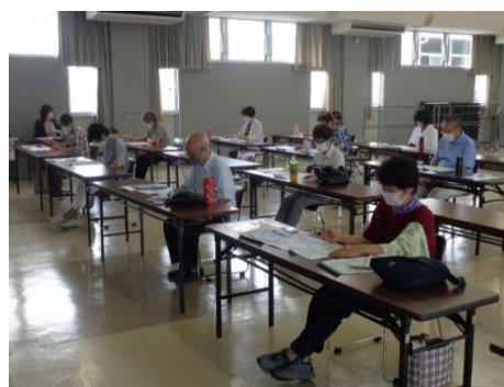
睡眠と健康の知恵袋