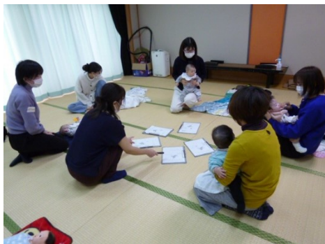
バランスシートを使い全員で話し

アンケートでは、とても分かりやすい講座で、有意義な時間を持てたという声をいただいた。