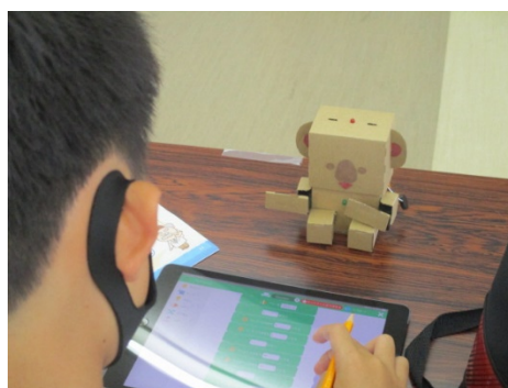
「プログラミング」考えながら進めています。