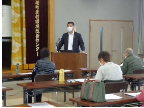
基礎から学ぶ相続対策