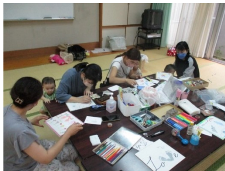
手形・足形アートを楽しむ様子