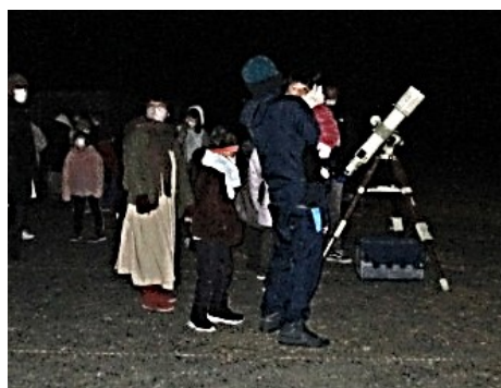
天体望遠鏡による星空観望②